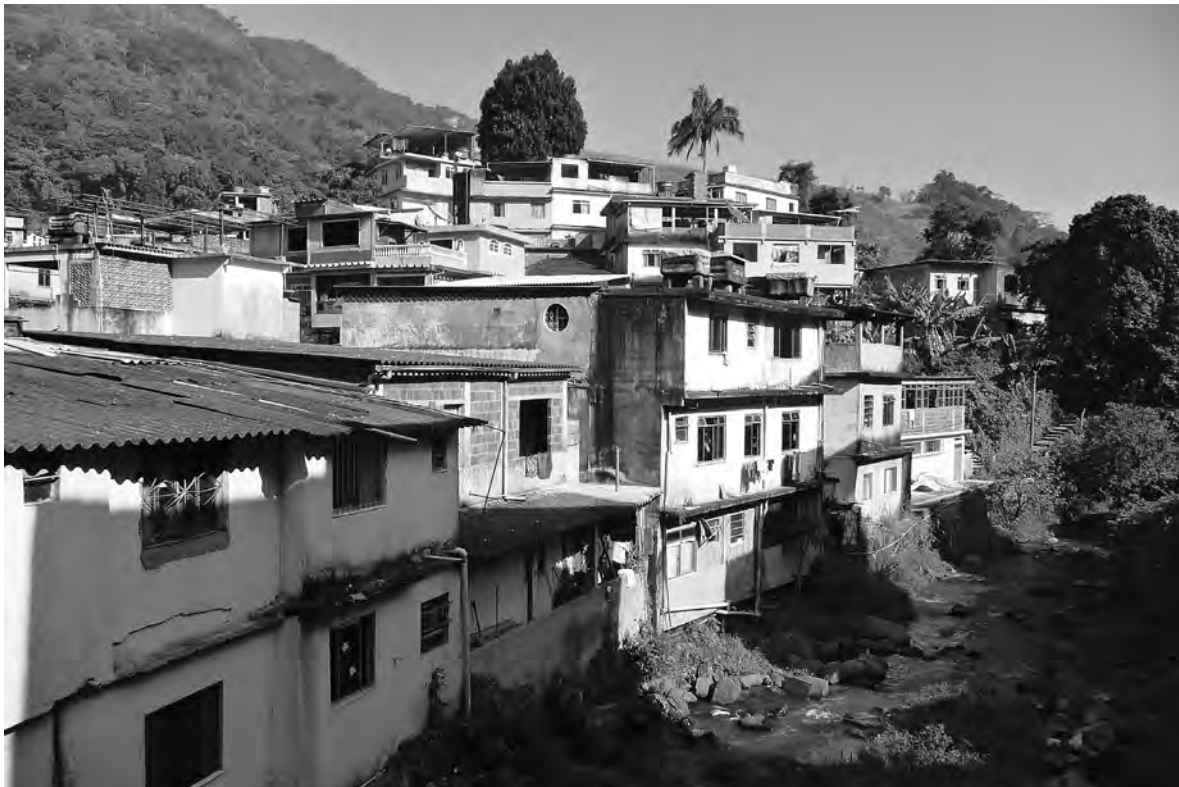
FIGURA 9 - O rio Cachoeira percorre a comunidade Mata Machado, perto da Estrada de Furnas. Apesar da instalação de sistemas de esgoto e de galerias pluviais na favela, eles nunca foram conectados ao sistema regional da cidade e continuam desembocando no rio.

Entre os vários problemas de infraestrutura da comunidade, o mais sério era a coleta de esgoto, mesmo depois que a cidade instalou uma rede de canos coletores na comunidade. Como a agência estadual de saneamento básico não instalara um sistema de esgoto na vizinhança que cerca a comunidade, o novo sistema da favela descartava o material no rio local (Figura 6.09). Os residentes tinham ciência desse problema, mas também sabiam que uma solução definitiva dependia das inconstantes políticas municipais e estaduais. O lixo não representava um problema muito grande, pois a cidade o coleta regularmente, mas os residentes precisam levar o lixo até recipientes perto de uma via pública onde passam os caminhões. Infelizmente, o rio ainda serve de depósito de lixo para algumas pessoas.