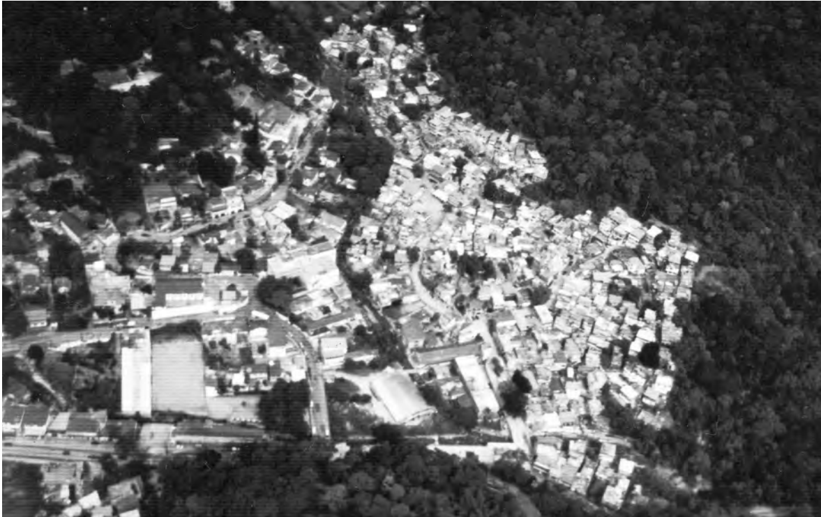
FIGURA 1 - Uma vista aérea mostra que a favela Mata Machado é limitada pela floresta (na direita e na parte superior da foto), pelo rio Gávea Pequena (corredor florestado no centro) e pela Estrada de Furnas (na parte inferior).

Perceived livability and sense of community: learning for/from favela mata machado, Rio de Janeiro, Brazil