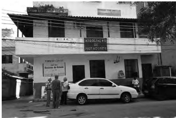
FIGURA 8 - Na praça principal, os residentes mais velhos conversam perto do prédio em que se encontra a associação dos residentes e os escritórios locais de uma fundação de obras sociais administrada pelo governo estadual, numa quinta-feira à tarde..